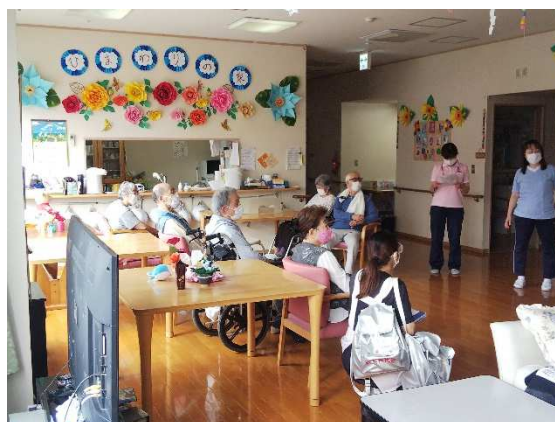
3事業所利用者さんと短時間交流しました